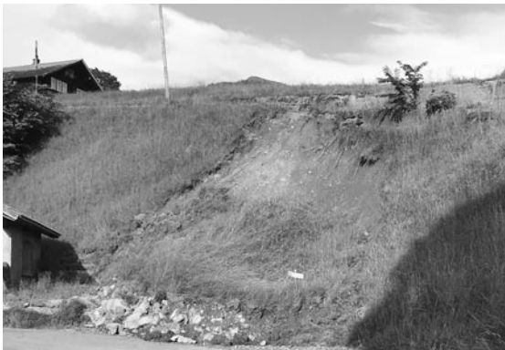
Murgang im Gebiet Bortli

Die Gemeinde Hasliberg blieb diesen Sommer lange von Gewittern verschont. Mitte Juli haben jedoch starke Niederschläge an einigen Orten Wege ausgespült und Murgänge verursacht. Der Gemeinderat dankt der Feuerwehr, der Schwellenkorporation, der Verstärkungsgruppe Wegunterhalt, der gemeindeeigenen Werkgruppe und allen übrigen Beteiligten, die mit entsprechenden Massnahmen schlimmere Schäden verhindert haben.